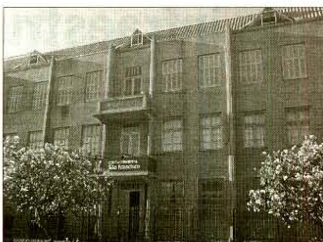
Eventos especiais marcarão o aniversário da escola

Além das atividades já tradicionais no calendário franciscano, estão programados para este ano eventos especiais, ainda